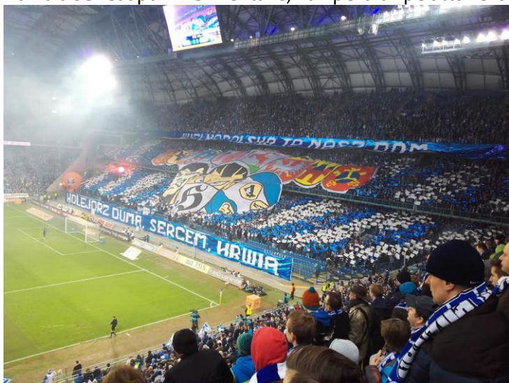
Lech – Legia. Tifo ja tunnelma katossa.